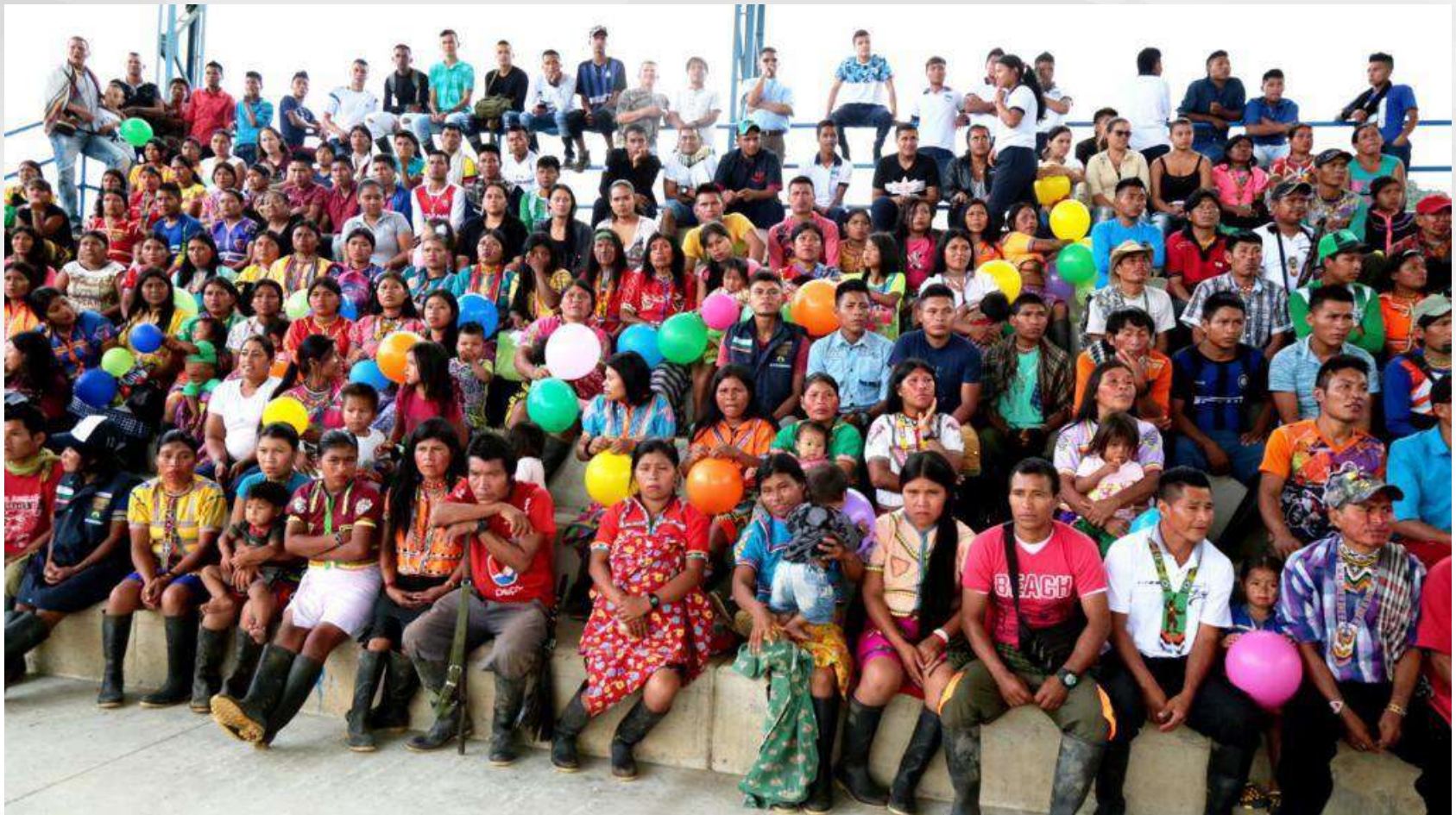
Jornada Humanitaria – Frontino, Corregimiento La Blanquita